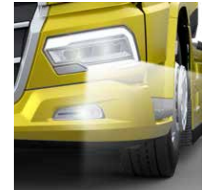
LED-TULED KOOS KURVI- JA UDUTULEDEGA