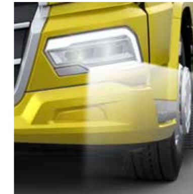
LED-TULED KOOS KURVITULEDEGA