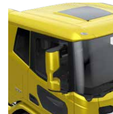
PEGLID JA NURGAKAAMERA