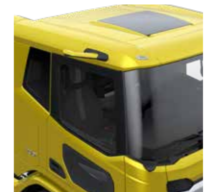
TAHAVAATEKAAMERAD JA NURGAKAAMERA